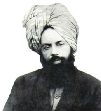
Hazrat Mirza Ghulam Ahmad 1835-1908

Es evidente que no no es posible amar a dos cosas al mismo tiempo: no es posible amar la riqueza y a la vez amar a Dios. Solo se puede amar a uno de ellos. Afortunado es el que ama a Dios. Si alguno de vosotros lo ama y gasta su riqueza en Su causa, estoy seguro de que su riqueza aumentará más que la de los demás, porque la riqueza no